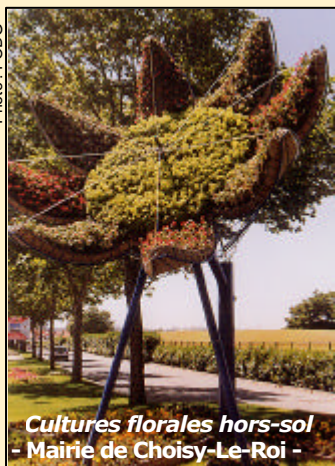
Cultures florales hors-sol - Mairie de Choisy-Le-Roi -