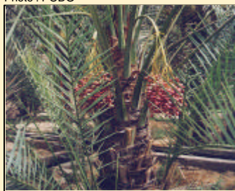
- Emirats Arabes Unis - Palmier dattier