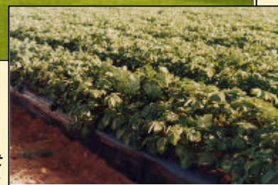
- Maroc - Cultures irriguées de Pommes de Terre à haut rendement