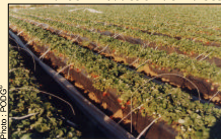
- Maroc - Production de Fraises