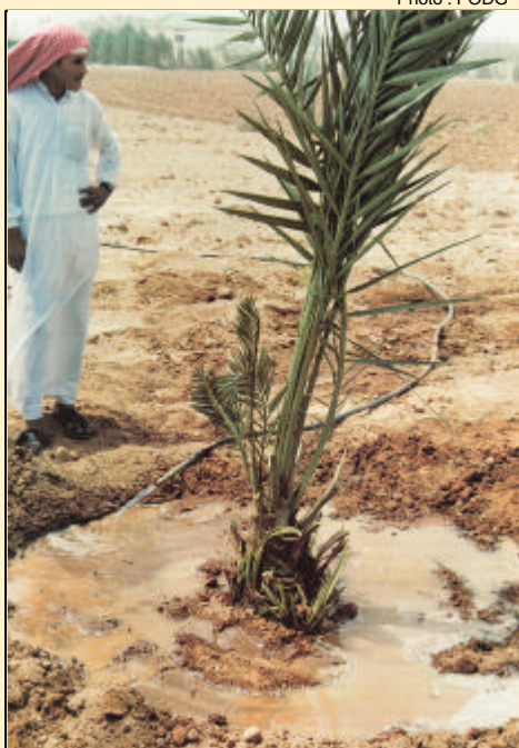
- Moyen Orient - Plantation de Palmiers dattier

L'efficacité de Polyter est reconnue aujourd'hui dans de multiples domaines de la production végétale au niveau mondial.