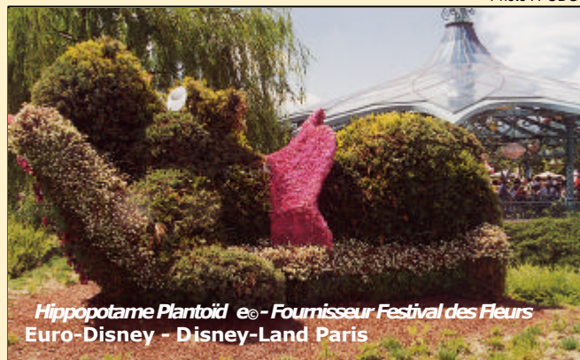
Hippopotame Plantoïd e® - Fournisseur Festival des Fleurs Euro-Disney - Disney-Land Paris